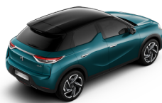
ノアールオニクス