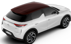
ダイヤモンドレッド