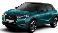
ブルー ミレニアム