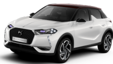
ブランパールナクレ