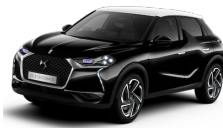
ノアールベルラネラ