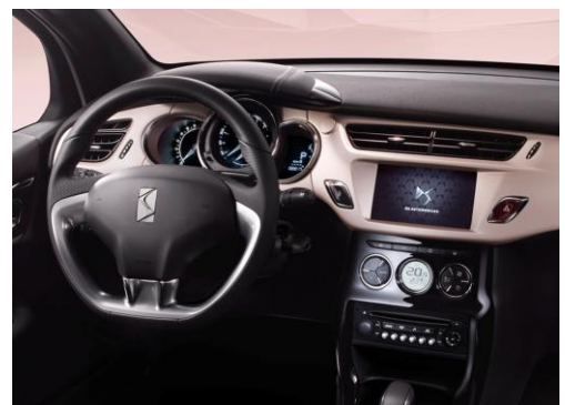
日本仕様は右ハンドル ナビゲーション:オプション

室内にもこの限定車ならではの特別仕様を多く採用しています。専用カラー「マットピンク」で仕上げられたダッシュボードは、淡いピンクが女性の肌を明るく健やかに見せる効果を狙っています。またパニティミラーの照明には自然光に近い LED を使用、ハリウッドミラーのように華やかに顔を映し出し、メイク直しに一役買います。さらにレザーのセンターアームレストにはジバンシイのロゴがレーザー加工され、フロアマットにも B ピラー同様のロゴを配しこのクルマの特別感をさらに演出しています。