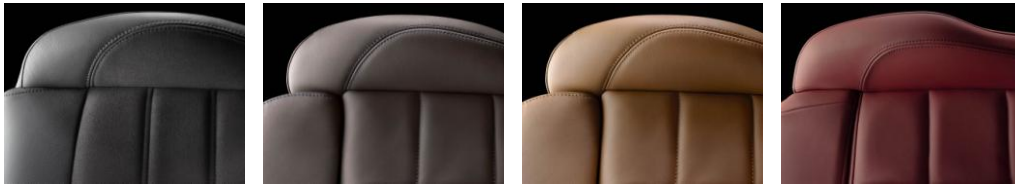
コンビネーション(ミストラル) クラブレザー(クリオロ) クラブレザー(フォヴ) クラブレザー(ルージュ)