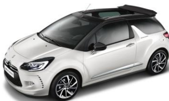
DS 3 CABRIO So Parisienne