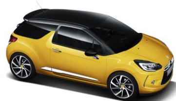
DS 3 Sport Chic