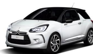
DS 3 So Parisienne