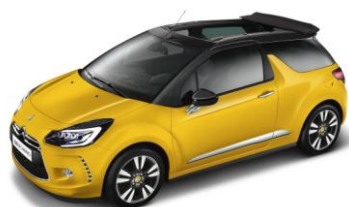
DS 3 CABRIO Chic