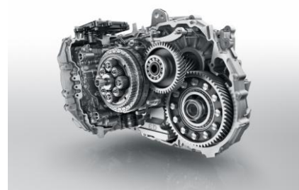
EAT 6 (Efficient Automatic Transmission)