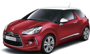
DS 3 Chic