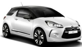
DS 3 Chic Xenon Full LED Package