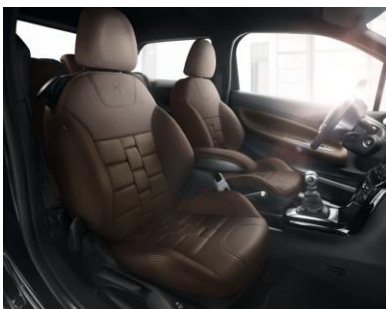
ナッパレザーシート (DS 3)