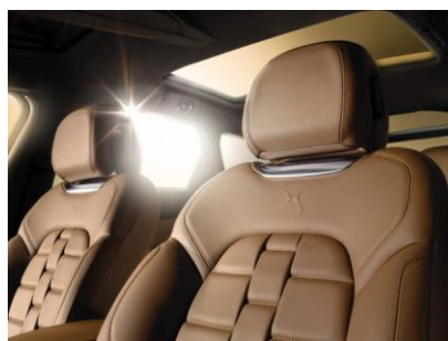
セミアニリンレザーシート (DS 4/DS 5)