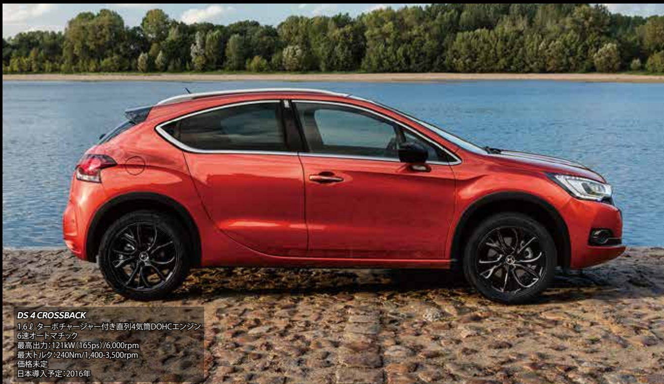
DS 4 CROSSBACK 1.6ℓ ターボチャージャー付き直列4気筒DOHCエンジン 6速オートマチック 最高出力: 121kW (165ps) / 6,000rpm 最大トルク: 240Nm / 1,400-3,500rpm 価格未定 日本導入予定: 2016年

The DS logo is placed in the center of the front grill, creating the presence of our new brand. The DS wing grill and the DS LED VISION headlights emphasize this identity.