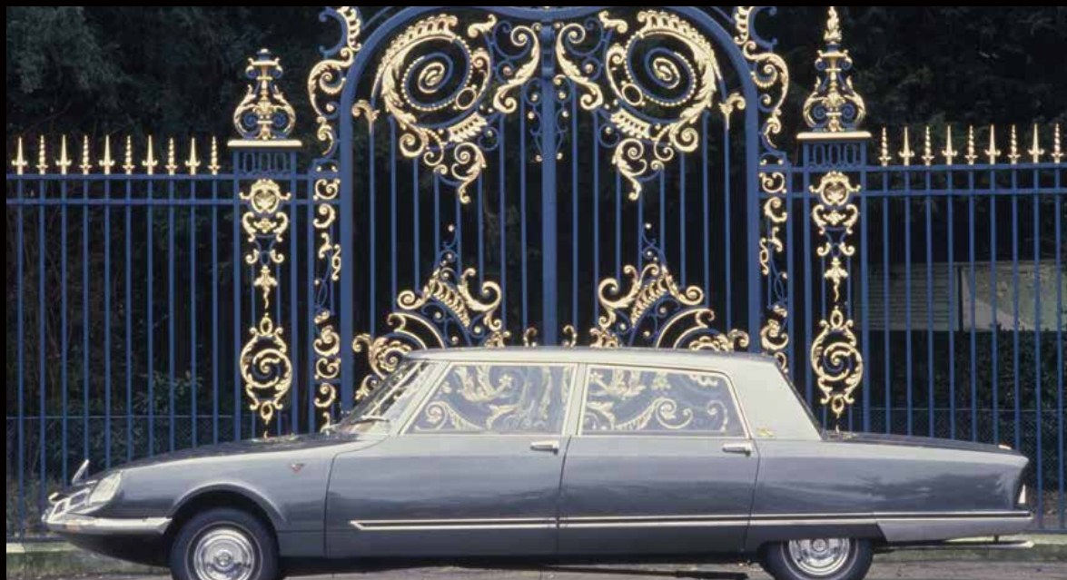
1968 DS Presidential with coachwork by Chapron (シャブロンが手がけたDSプレジデンシャル、1968年)

To replace the limousine produced in 1955 on the base of the Traction Avant by the coachbuilder Franay, the French president commissioned a new state vehicle, which was delivered to the Elysée Palace on 14 November 1968. The specifications called for a vehicle longer than the Lincoln used at the time by the US president. Developed and built by Henri Chapron, the unique DS model measured 6.53 metres long and boasted ultra-luxurious equipment, with a convex and inclined separation window, brown leather upholstery, a fold-down seat for interpreters, electric windows, air conditioning, direct and indirect lighting, an interphone and a built-in minibar.