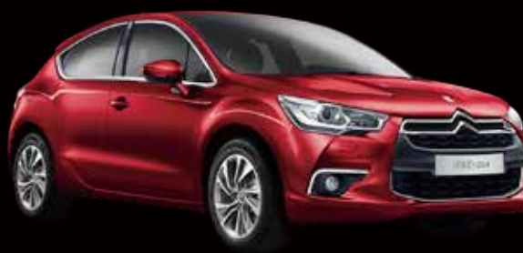
DS 4 シック 1.6ℓターボ 6速AT (EAT6) 5ドア 車両本体価格: ¥3,200,000 (税込)

カテゴリーを超越した唯一無二のスタイル、 クラフトマンシップが息づくインテリア。 ダイナミックなドライブフィール。鮮烈な存在感を 放つミドルレンジクロスオーバー。