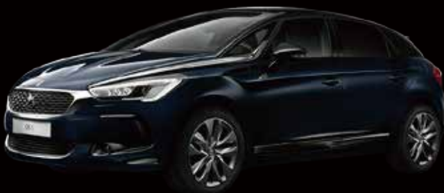
DS 5 Edition 1955 1.6ℓターボ 6速AT 5ドア 車両本体価格: ¥4,600,000 (税込)

DSのフラッグシップモデル、DS 5。 アートとも呼べる美しいフォルム、マテリアルを 厳選したインテリア、洗練を極めた走り。 新しいフロントフェイスを身につけた。