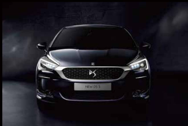
NOUVELLE DS 5 (ディヴィーヌDS)