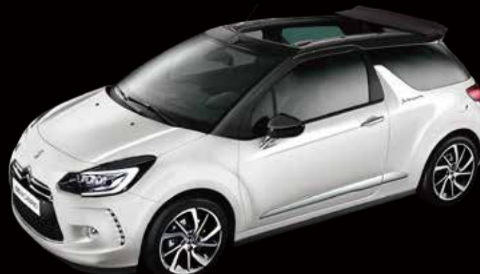
DS 3 カブリオ So Parisienne (ソーパリジェンヌ) 1.2ℓ PureTechターボ 6速AT (EAT6) 3ドア 車両本体価格: ¥3,110,000 (税込)