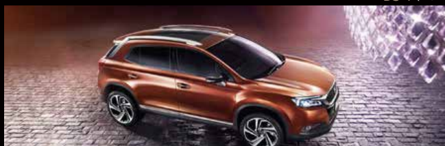
DS 6 (DS 6)