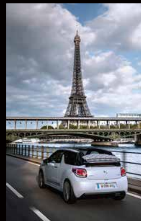
DS 3 CABRIO (DS 3 カブリオ)