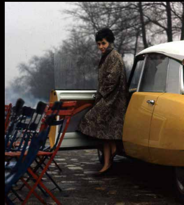
DS 19, 1960 (DS 19、1960年)