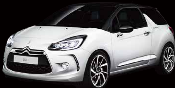
DS 3 So Parisienne (ソーパリジェンヌ) 1.2ℓ PureTechターボ 6速AT (EAT6) 3ドア 車両本体価格: ¥2,810,000 (税込)