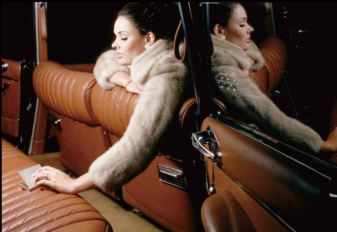
DS 21 Pallas, 1967 (DS 21パラス、1967年)

新型DSパラスがお披露目されたのは1964年のパリ・モーターショーで、それまでのフランスの自動車にはなかった装備が施されていました。他のDSモデルにもないラグジュアリーな装置があり、クロームのドアハンドル、特別な装飾、クロームで縁どられたリアランプ、補助ヘッドランプなどを備えていました。シートはさらに厚みを増し、背もたれは大きく、オプションとして革張りも用意されました。DSパラスのボディカラーは他のDSモデルと同じでしたが、メタリック塗装がラインナップに加わりました。