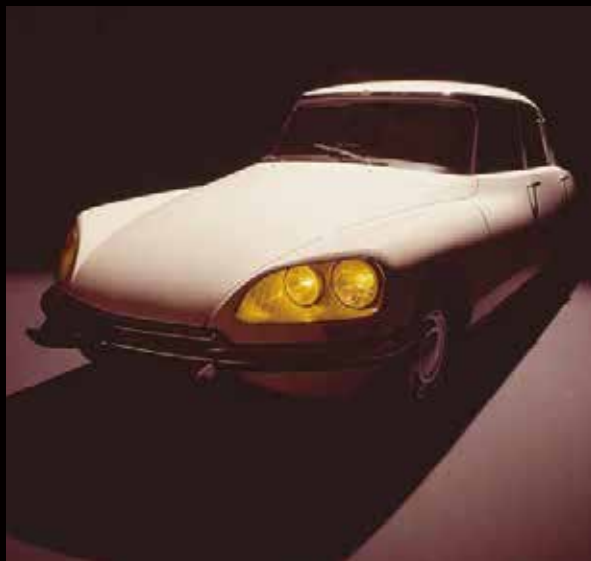
DS 21 Pallas, 1969 (DS 21 パラス、1969年)