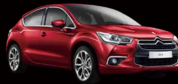
DS 4 シックキセノンパッケージ 1.6ℓターボ 6速AT (EAT6) 5ドア 車両本体価格: ¥3,400,000 (税込)