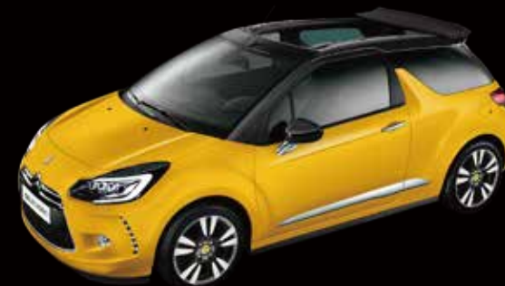
DS 3 カブリオ シック

コンパクトなボディに、オープンエアがいつでも気軽に楽しめる電動ソフトトップを採用。新しいパワートレインでさらに走りに磨きをかけた、5シーターオープン。