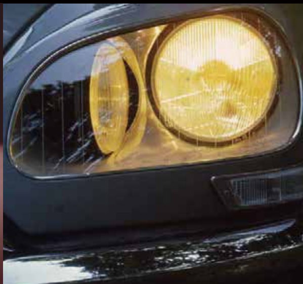
DS 21, 1969 (DS 21、1969年)

1964年にDSパラスが登場、その翌年の1965年10月には新型高性能DSが発表されました。この新型DSは2,175ccエンジンを搭載し、出力109馬力、最高時速175kmを実現しました。DS 21は1955年以来のDS 19ファミリーとなりました(名称は排気量を起源としています)。さらに1967年にはニューフェイスが登場し、誰もが賞讃する優れた外観はもちろんのこと、新たな安全機能として、ハイエンドのプレステージ、パラス、カブリオにも標準装備されていなかった可動ヘッドライトを装備しました。これによって、コーナーリングでの照射が可能になったのです。