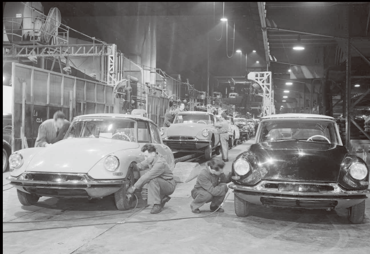
DS assembly line at Javel, December 1955 (ジャベル工場のDSアッセンブルライン、1955年12月)

DS production began on 7 October at the Javel plant in Paris (France), the day after its Paris Motor Show debut. The first models on the road turned many a head with their outstanding originality. The car's pioneering technical and aesthetic solutions stirred endless curiosity since, not content with being a true automotive sculpture, the DS was also a concentrate of advanced technology. Its hydropneumatic suspension provided unprecedented levels of roadholding and comfort. And in an all-new safety feature, the DS 19 boasted an extremely powerful hydraulic braking system, shocking some first-time drivers with its ultra-short stopping distance.