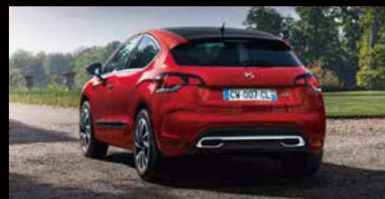
DS 4 (DS 4)