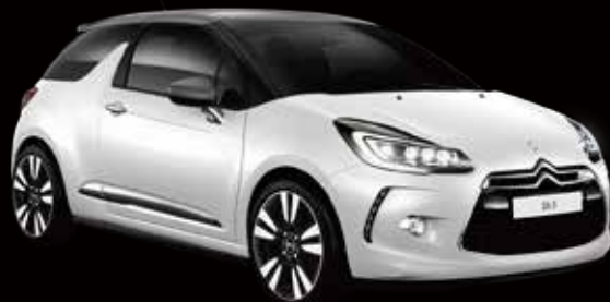
DS 3 シック キセノンフルLEDパッケージ