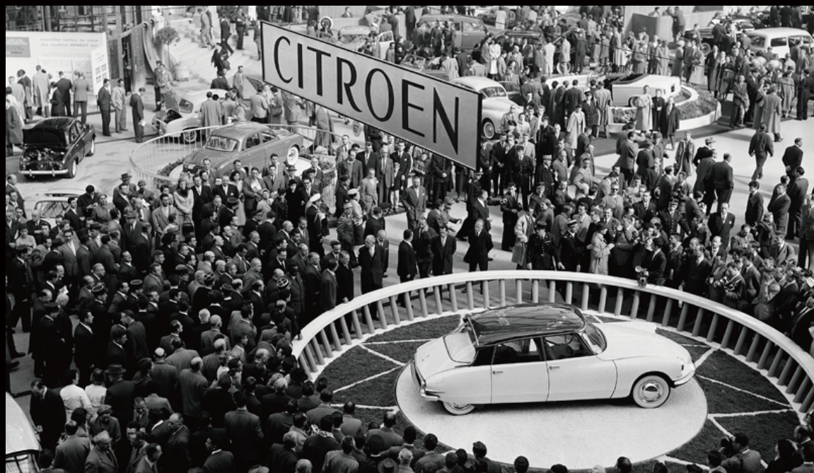
D19 at Paris Motor Show, 6 October 1955 (パリ・モーター・ショーでのDS 19, 1955年10月6日)

DSは1955年10月6日木曜日にパリ・モーターショーでデビューしました。グラン・パレの高い屋根のもとに展示されたDSは、驚きと賞讃をもって迎えられました。アヴァンギャルドなボディデザインは、ただちに新たな規範となりました。来場者やジャーナリストはこの新しい自動車の魅力に取りつかれ、ライバルの自動車メーカーもこの天才的な作品を褒め讃えるしかありませんでした。DS 19はモーターショーの初日だけでおよそ12,000台を販売しました。10日後、パリ・モーターショーが閉幕した時点では8万台が受注されたのです。