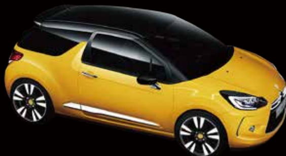
DS 3 スポーツシック