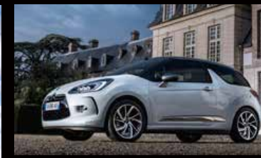
DS 3 (DS 3)