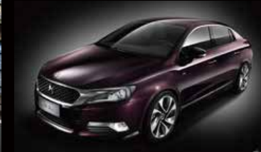
DS 5LS (DS 5LS)

ハイエンドのフランス車を復活させるという構想のもと、DSは、2014年6月1日に正式にブランドとして独立しました。DSは1955 DS以来の革新とオリジナリティという価値を高く掲げています。個性を重んじるカスタマーに向け、DS 3、DS 3カブリオ、DS 4、DS 5、DS 5LS*、DS 6*のラインナップを揃えています。DSブランドが立ち上げられた2015年は、オリジナルDSの誕生60周年でもあります。