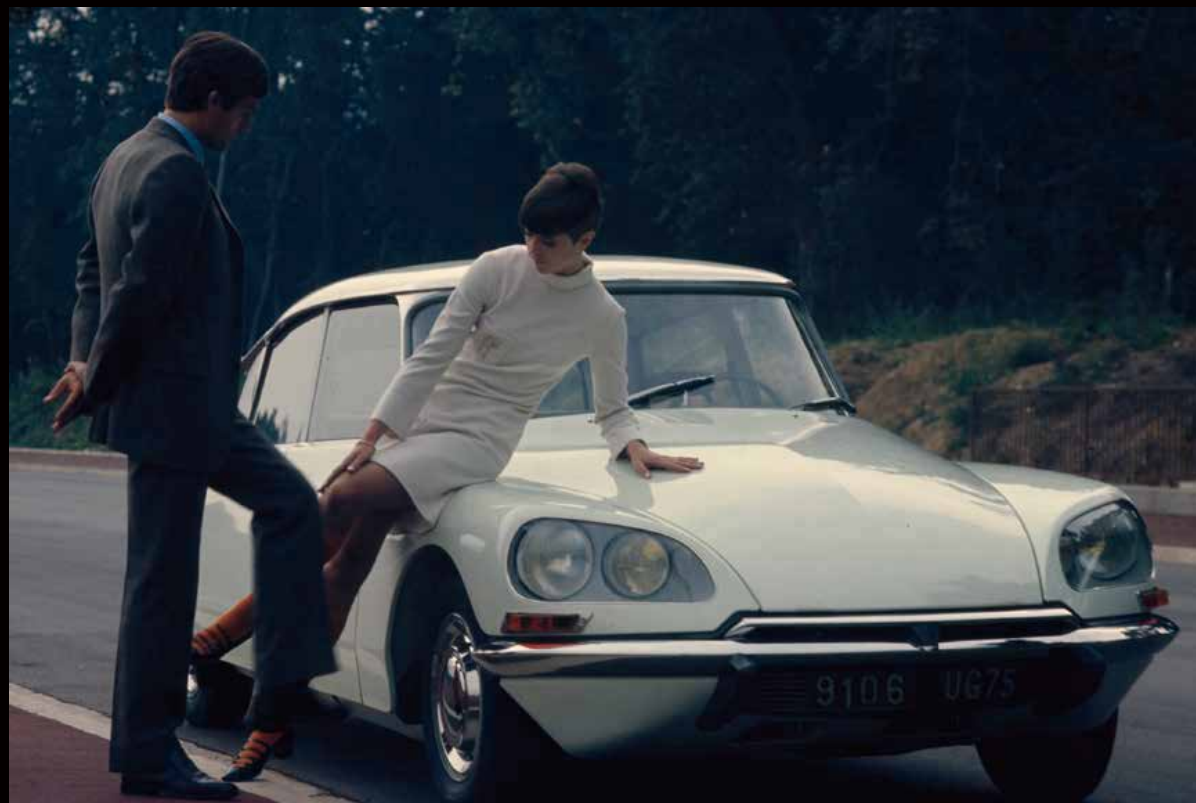
DS 21, 1968 (DS 21、1968年)

After the arrival in September 1968 of an all-black dashboard and the replacement of the DS 19 by the DS 20, 1969 saw the advent of an entirely redesigned dashboard featuring three large dials and topped by a visor across its entire width. But 1969 was above all marked by a major powertrain upgrade. The DS 21's 2,175-cc engine was fitted with electronically-controlled fuel injection, increasing power to 139 bhp and top speed to over 185 km/h. More than ever, the DS asserted its position in relation to the competition and stood as a singular car from all points of view.