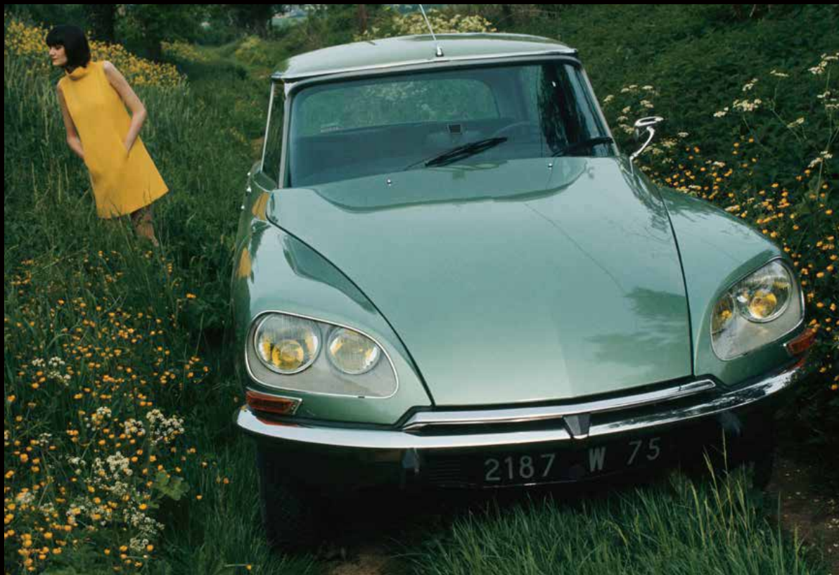
DS 21, 1972 (DS 21, 1972年)

1970年と1971年のDSの改良はトランスミッションが中心です。1970年9月、DSのマニュアル・ギアは4速から5速になりました。さらにその翌年にはボルグ・ワーナー社製の3段自動変速ギアが導入されました。1975年7月、DSは20年の歴史に終止符を打ちましたが、その前の最後のモデルチェンジとして1972年9月にDS 21の後継車、DS 23がエンジン排気量2,347cc、電子制御燃料噴射方式、141馬力、最高時速190kmというスペックで発売されました。