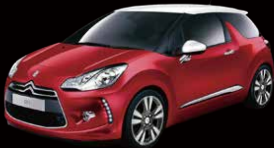
DS 3 シック