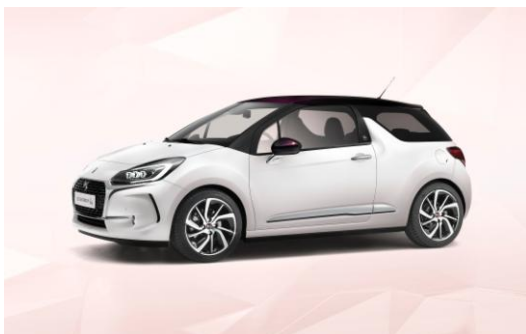
DS 3 GIVENCHY Le Make Up